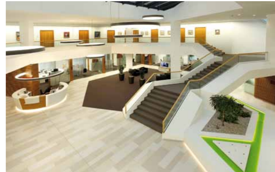
▲ Zentrale Freitreppe und Wasserlauf

Im Zuge der Baumaßnahme erhielt die weitläufige Kundenhalle auf einer Gesamtfläche von rund 1.250 m 2 eine völlig neue Gliederung sowie eine einladende optische Erscheinung. Grundlage für die räumliche Konzeption war die konsequente Bezugnahme auf die vorhandene Geometrie des Gebäudes mit seinen charakteristischen architektonischen Elementen. Unterstützt wird der helle und offene Charakter der Kundenhalle durch das mit einem neuen und innovativen Sonnenschutzsystem ausgestattete Glasdach. Für individuelle und diskrete Beratungen