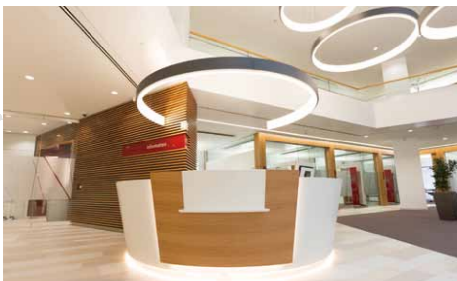
▲ Offene und freundliche Empfangstheke