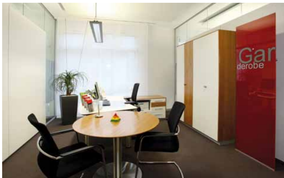
▲ Diskretes Beratungsbüro

Farben und Materialien. Eine Vielzahl an Geldmarktdienstleistungen steht den Kunden hier zu jeder Tag- und Nachtzeit zur Verfügung. Neben klarer Raumgliederung durch betonte horizontale und vertikale Linienführung wurden bewusst runde sowie organische Formen in das Gesamtkonzept integriert. Der Empfangscounter steht ohne Ecken und Kanten als zentrale Anlaufstelle im Raum. Durch seine runde Form ist er nach allen Seiten offen und vermittelt so eine freundliche Willkommens-Atmosphäre, die durch Leuchtbänder am Fuß und über dem Counter auch lichttechnisch unterstützt wird.