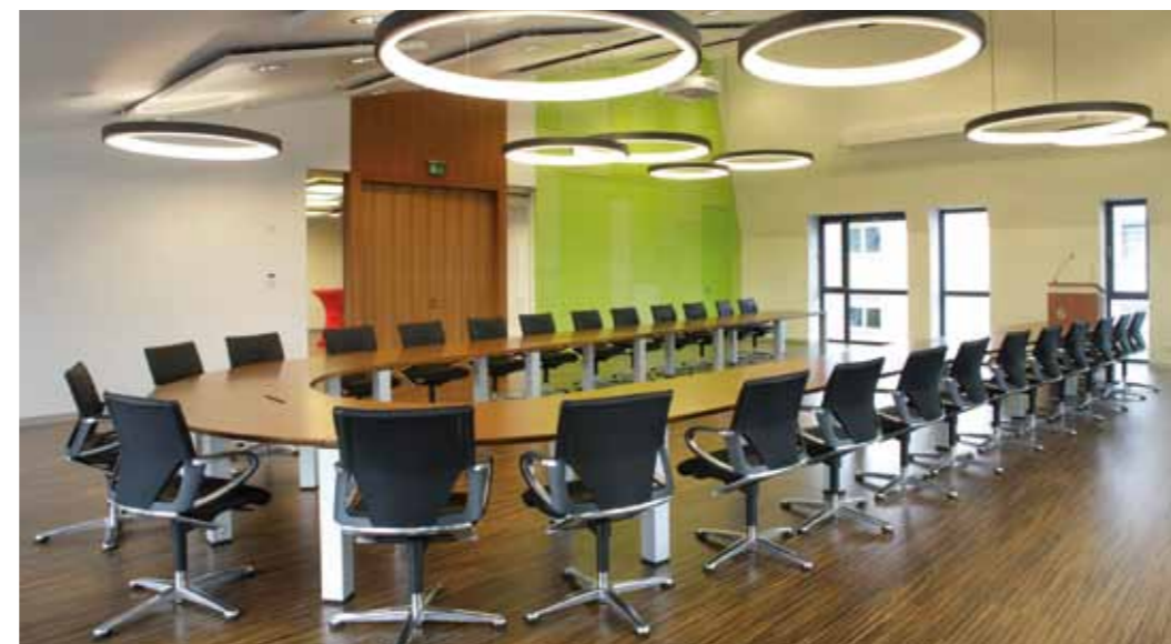
▲ Multifunktionaler Konferenzraum

Die frische Farbgebung der Wände in Kombination mit dem warmen Ton des Parkettbodens sowie den großzügigen Fensterflächen, die einen weiten Blick zulassen, und der besondere, überraschende Zuschnitt des Raums, schaffen Identität und Aufenthaltsqualität. Durch die Umsetzung eines flexiblen Bestuhlungskonzeptes sowie einer variablen Tischanlage bietet der Konferenzraum je nach Nutzung Platz für bis zu 27 Konferenzteilnehmer oder bis zu 80 Personen bei einer Veranstaltungsbestuhlung. Durch eine