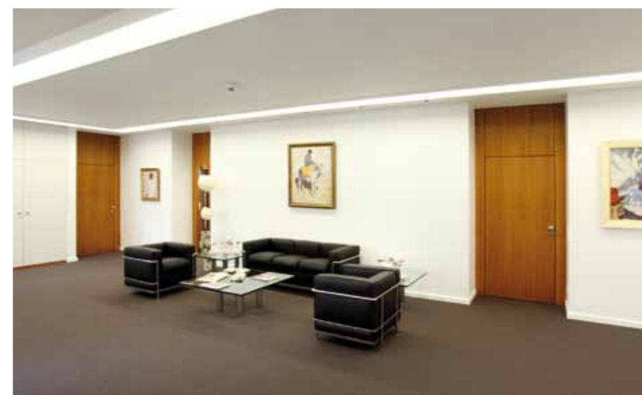
▲ Stilvoller Wartebereich Vorstandsetage

praxisorientierte Planung und Anordnung des Stuhl- und Tischlagers gelingt der Umbau zwischen den unterschiedlichen Nutzungsarten innerhalb kürzester Zeit. Der Einsatz von modernster Medientechnik, weitgehend unsichtbar verbaut in der Tischanlage und im mobilen Rednerpult, erlaubt den Einsatz zeitgemäßer Präsentationstechniken und unterstützt die vielschichtigen und flexiblen Nutzungsmöglichkeiten des Raumes.