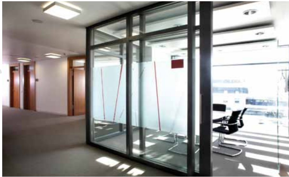
▲ Lichtdurchfluteter Besprechungsraum

stehen nun neu geschaffene Bereiche mit natürlicher Belichtung und Belüftung in ausreichender Anzahl zur Verfügung und bieten Potenzial auch für zukünftige Nutzungen. Ausgehend vom Bestand in den oberen Etagen und dem Vorstandsbereich wurde als Holzart Kirschbaum gewählt. Helle und erdige Farbtöne in Verbindung mit fließenden Formen kontrastieren mit klarer Linienführung im Boden- und Deckenbereich und bieten somit Orientierung und eine klare Struktur.