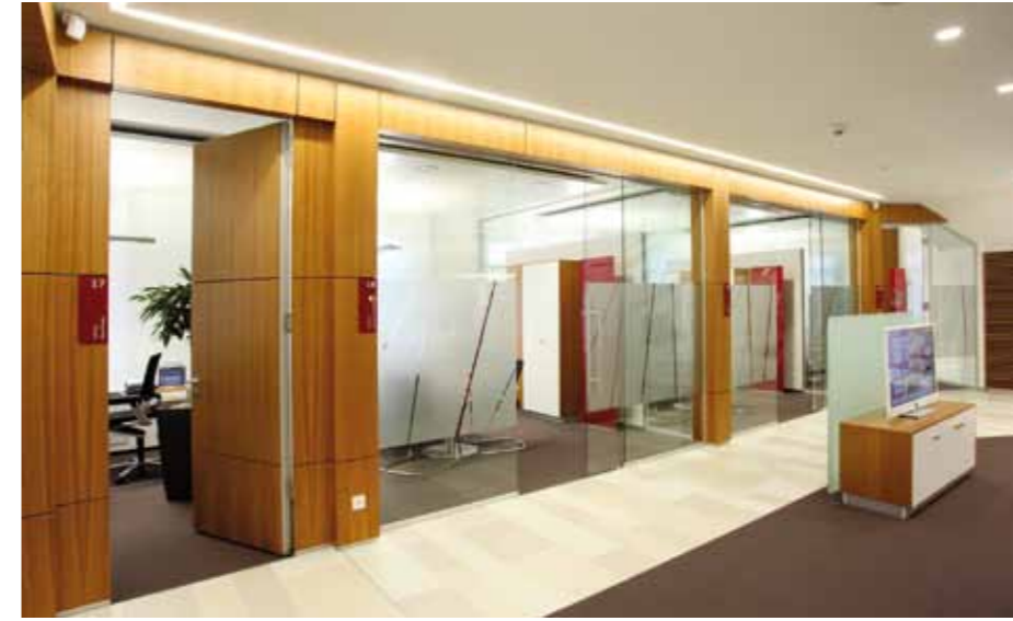
▲ Transparente Trennwand zu den Beratungsbüros