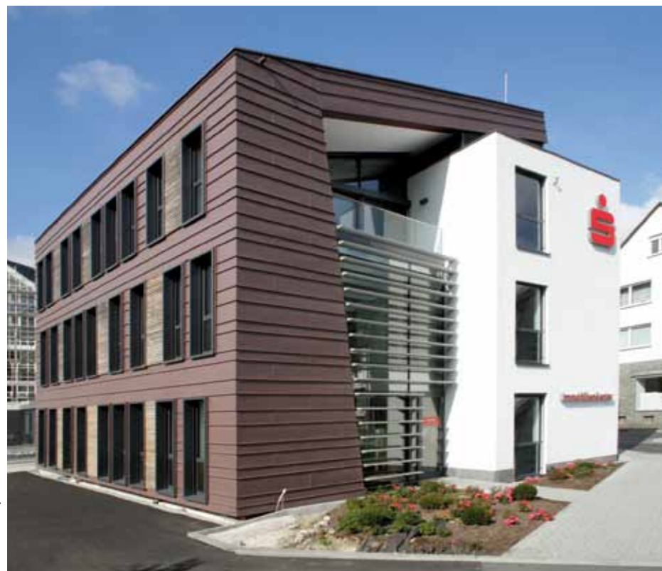
▲ Moderner Erweiterungsneubau