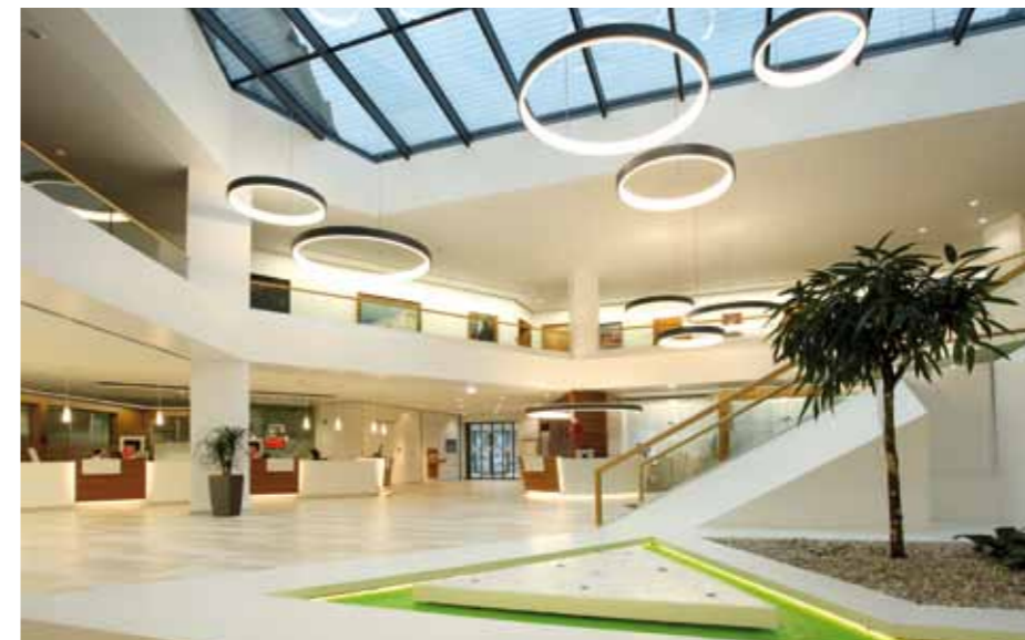
▲ Raumgliederung durch gezielt eingesetzte Lichtakzente