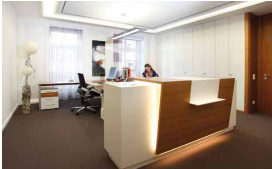
▲ Eleganter Empfang im Vorstandsbereich

stehen nun neu geschaffene Bereiche mit natürlicher Belichtung und Belüftung in ausreichender Anzahl zur Verfügung und bieten Potenzial auch für zukünftige Nutzungen. Ausgehend vom Bestand in den oberen Etagen und dem Vorstandsbereich wurde als Holzart Kirschbaum gewählt. Helle und erdige Farbtöne in Verbindung mit fließenden Formen kontrastieren mit klarer Linienführung im Boden- und Deckenbereich und bieten somit Orientierung und eine klare Struktur.