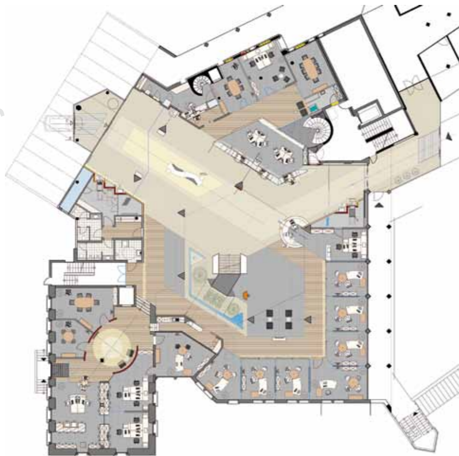
▲ Grundriss Erdgeschoss

Zusammenspiel einer mehr als alle Vorgaben erfüllenden Gebäudehülle, einer modernen Gebäudetechnik und der Nutzung regenerativer Energien erreicht. Durch zwei Zugänge, jeweils mit eigenem SB-Bereich, gelangen die Kunden in das großzügige Entrée, wo ihnen eine Vielzahl an Geldmarktdienstleistungen zu jeder Tag- und Nachtzeit zur Verfügung stehen. Bereits im Sommer 2011 begannen die Arbeiten mit einem Erweiterungsbau und ab Herbst 2012 wurden die Büroräume im Bestandsgebäude sowie die Kundenhalle neu gestaltet. Anfang 2014 wurden die Bauarbeiten abgeschlossen und die neuen Räume der Öffentlichkeit an einem Tag der offenen Tür feierlich vorgestellt.