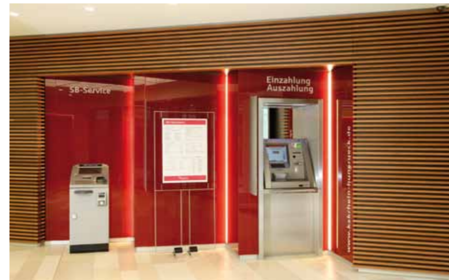
▲ Ansprechender SB-Bereich