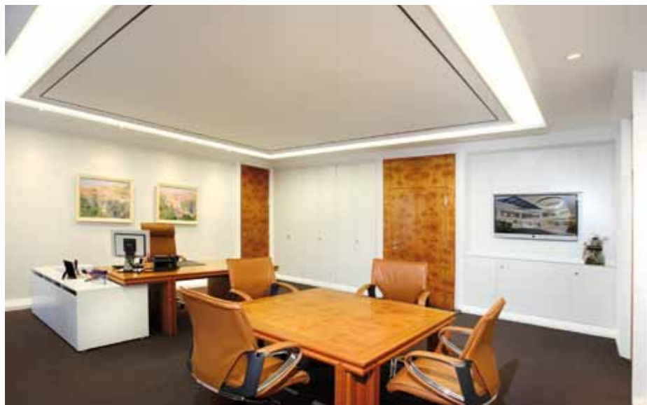
▲ Büro Vorstand

Dies wird auch durch den Materialmix von Stein, unterschiedlichen Hölzern, Glas und Leder nicht nur sichtbar, sondern auch haptisch erfahrbar. Als gestalterischer Akzent wurde um die zentrale Freitreppe als Reminiszenz an die Namensgebung der Stadt Simmern, „Simera“ = Binsen/feuchte Aue, ein farblich betonter Wasserlauf platziert, der durch sein sanftes Plätschern eine ruhige und angenehme Stimmung vermittelt und trotz der Offenheit der Architektur vertrauliche Gespräche ermöglicht.